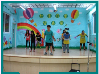
成果展中學生們卯足全力展現自己的才藝。