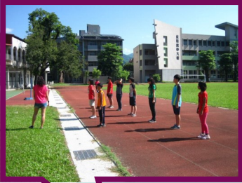
各班代表在運動會開幕前準備宣示。