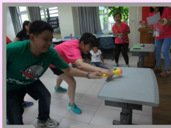
老師和學生們在小學堂中玩的不亦樂乎。