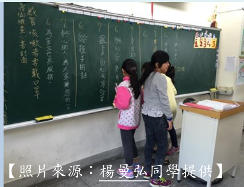
學生上台習寫討論結果