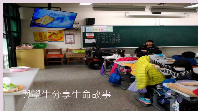
與學生分享生命故事