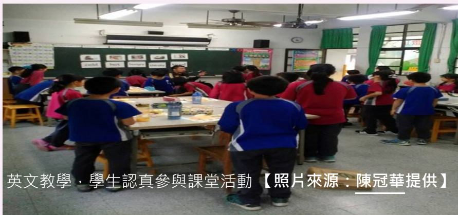
英文教學，學生認真參與課堂活動